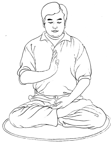
Tenir une main dressée