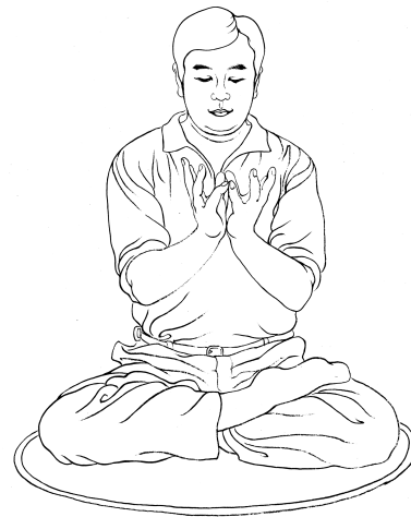
La position des mains en lotus

Fa djeun'g t'hièn coun sié eu t'huan mié